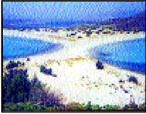
Ο Πελαγόςμικτος Σίμος