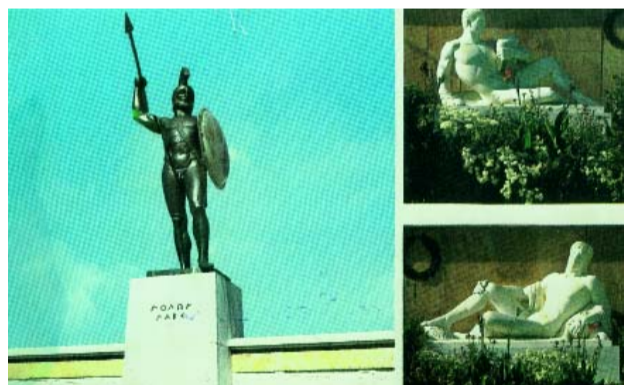
Ο ΛΕΩΝΙΔΑΣ ΣΤΙΣ ΘΕΡΜΟΠΥΛΕΣ Η μάχη έγινε το 480 π.Χ. Αύγουστος 1972 - Τζ. Πασσάκος