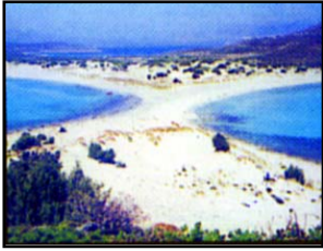
Ο Πελαγόσμητος Σίμος