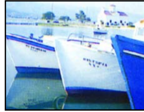
Άγ. Σπυρίδων - Λιμάνι

ΔΙΜΗΝΙΑΙΑ ΕΦΗΜΕΡΙΔΑ ΤΟΥ ΣΥΛΛΟΓΟΥ ΕΛΑΦΟΝΗΣΙΩΤΩΝ ΑΘΗΝΑΣ - ΠΕΙΡΑΙΑ «Ο ΦΙΛΟΠΑΤΡΙΣ»